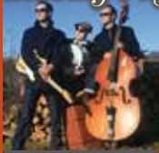
The Kentucky Boys